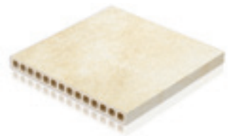
400 x 400 x 35 mm