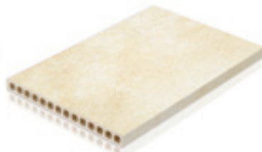
400 x 600 x 35 mm