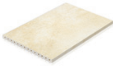
400 x 600 x 20 mm

Ein Element in der Stärke 20 mm: Leicht und schlank, um den Grenzen der Belastbarkeit, der Statik und der vorgefundenen Aufbaukonstruktion gerecht zu werden. Oder satt in einer Stärke von 35 mm. Auf der Terrasse und auch auf der Treppe bieten das neuen Keraelement® von Ströher individuellen Komfort. Keraelement® ist das Tüpfelchen auf dem „i“ in Sachen großzügiger Bodenoptik: fest verlegt oder auch lose. Auf der Fläche oder im Raum auf der Treppe.