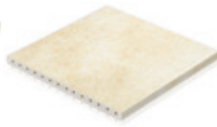
400 x 400 x 20 mm